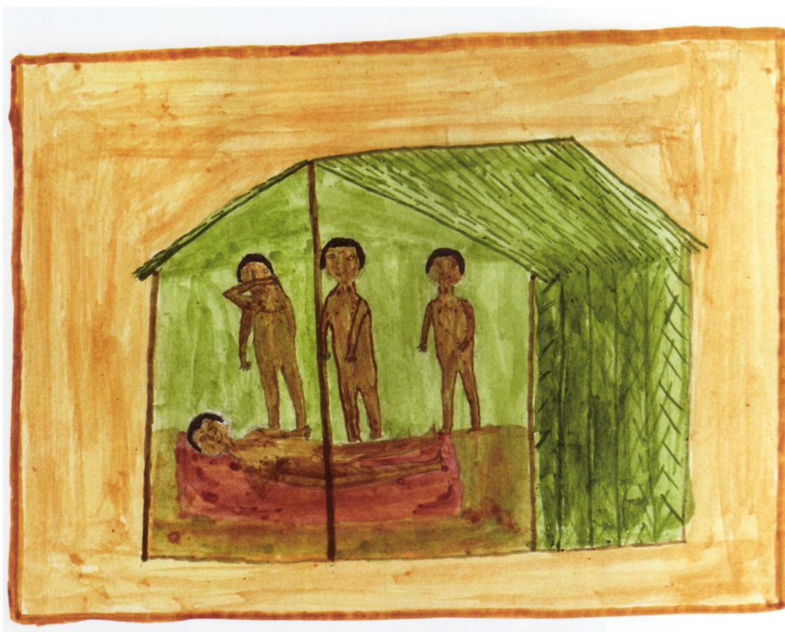
FIGURA 3 – Ūpakut há paye xop te ta tuk tex yãmĩyxop kutex, ax hã – Os pajés cantam para o doente o canto de ritual (MAXAKALI, 2008, p. 103)

espírito não vai no corpo dele” (MAXAKALI, 2008). Ao mesmo tempo em que cantam, os homens conversam alegremente. Do lado de fora da casa, as mulheres servem uma farta refeição que é degustada por todos com muitos risos e brincadeiras. A demonstração de felicidade de todos tem o objetivo de ajudar o doente a ficar alegre e esquecer o parente morto. Alimentos são preparados também para serem oferecidos aos espíritos que levarão o morto embora.