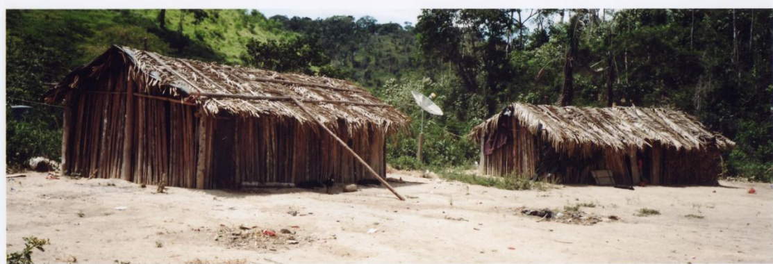
FOTOGRAFIA 1 – Casas Maxakali (Aldeia Verde)

Aldeia Verde é uma área coberta com grande quantidade de mata. O grupo que vive nessa terra tem cuidado dessa vegetação, procurando possibilitar um aumento em sua densidade e, conseqüentemente, um aumento da quantidade de animais que nela vivem. Eles esperam, em pouco tempo, ter melhores condições de caça e coleta para a realização dos rituais e produção artesanal.