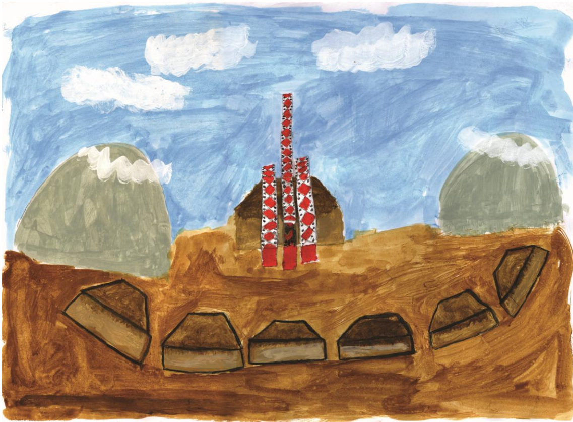
FIGURA 1 – Apné xi kuxex – Aldeia e casa de religião (MAXAKALI, 2008, p. 147)

Nas terras indígenas onde fica Aldeia Verde, há também uma construção inacabada em alvenaria que seria a sede da antiga fazenda. Nesse espaço funcionam a escola e o posto da Fundação Nacional de Saúde – FUNASA.