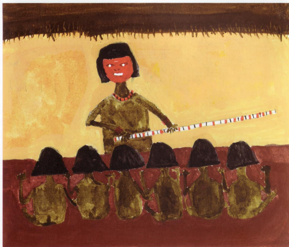
FIGURA 2 – Mĩmkuĩn hã xape xop yũmũgãhã – Mĩmkuĩn ensina aos parentes (MAXAKALI, 2008, p. 145)

convívio da mãe e da comunidade. No entanto, não poderão contar nem à mãe nem às outras mulheres e crianças que ainda não foram iniciadas, sobre as coisas que aprenderam na kuxex . A partir de então, a ũgtok estará com a “memória aberta” e passará a participar da vida religiosa da comunidade. Ela terá um yãmĩy que ficará em seus cabelos acompanhando-a sempre (Maxakali, 2008).