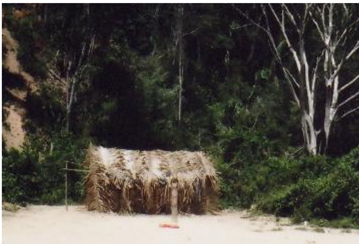
FOTOGRAFIA 2 – Kuxex – Casa de Religião (Aldeia Verde)

A kuxex é um espaço frequentado apenas por homens. As mulheres são proibidas de entrar na casa de religião. Até a idade de 6 ou 7 anos, os meninos também não podem entrar na kuxex , pois não foram ainda iniciados, ou seja, preparados para receber o seu yãmĩy e poderem participar do ritual sagrado dos yãmĩyxop – grupo de espíritos.